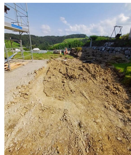
Hier sieht man den kompletten Prozess, eines Wassertank-Projekts der Crivelli Gartenbau GmbH in Herisau - vom Aushub bis zum Endergebnis.